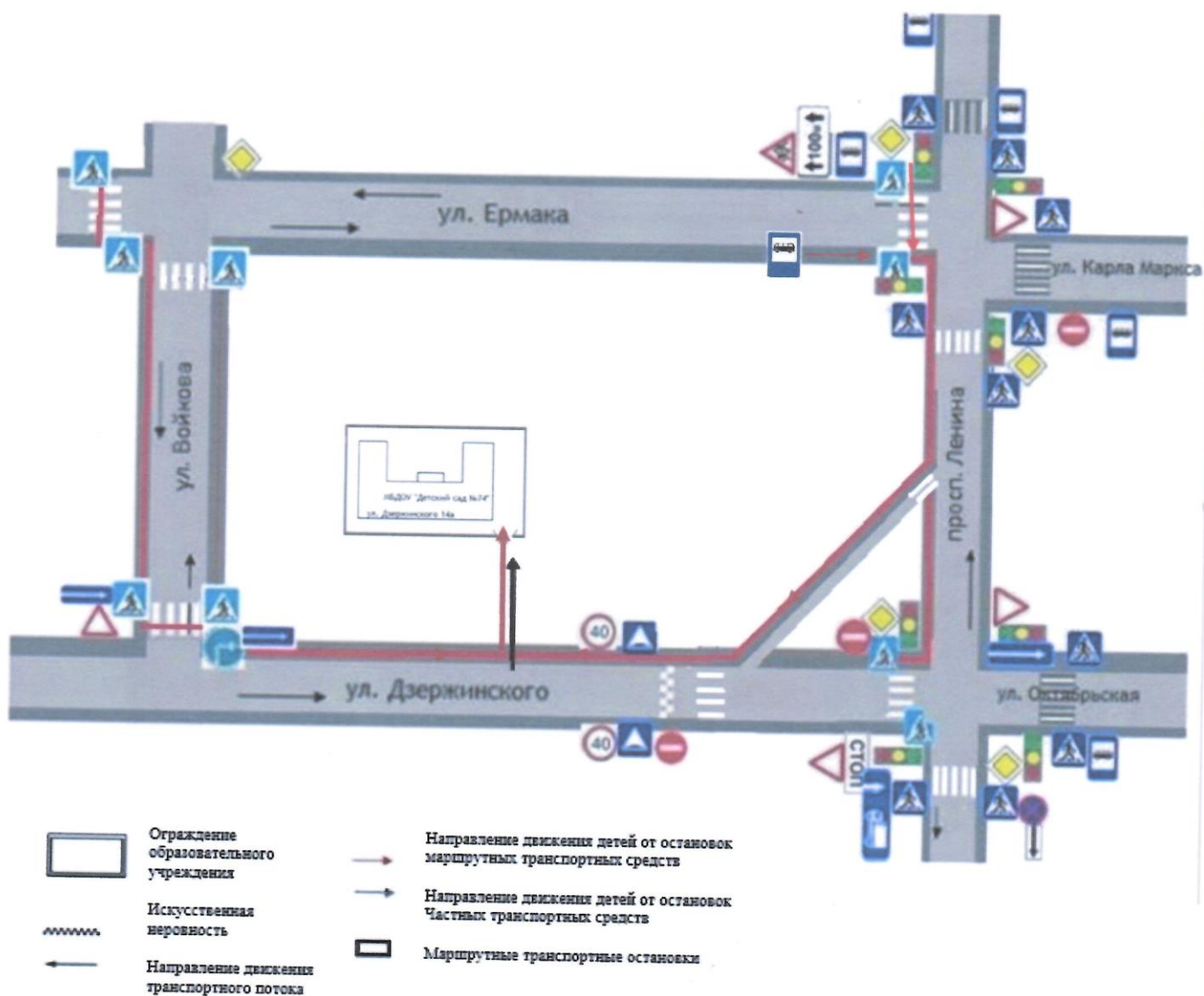
Схема организации дорожного движения в непосредственной близости от образовательного учреждения с размещением соответствующих технических средств, маршруты движения детей и расположение парковочных мест